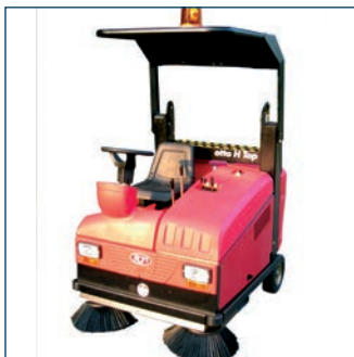
Bestuurderskap Toit de protection