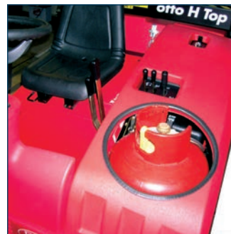
LPG systeem Installation GPL