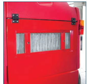
Filterzak Filtres à poches