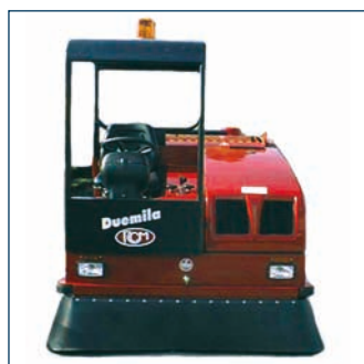
Bestuurderskap en stofgeleider Toit de protection et convoyeur de poussière