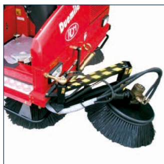
Derde zijborstel met zwenkarm Troisième brosse avec bras pivotant