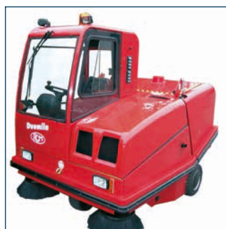
Cabine en werkluchten Cabine et feux avant