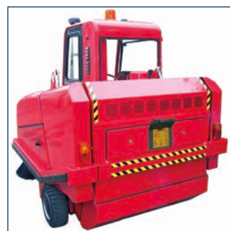
Kit voor goedkeuring als straatveegmachine Kit d'homologation routière